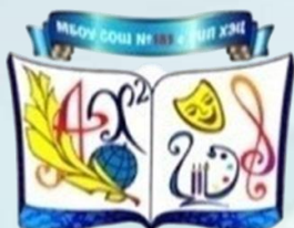
МБОУ г. Новосибирска «Средняя общеобразовательная школа №183»