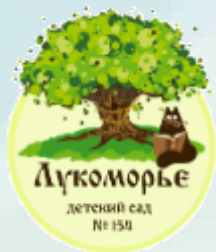
МАДОУ г. Новосибирска «Детский сад №154»