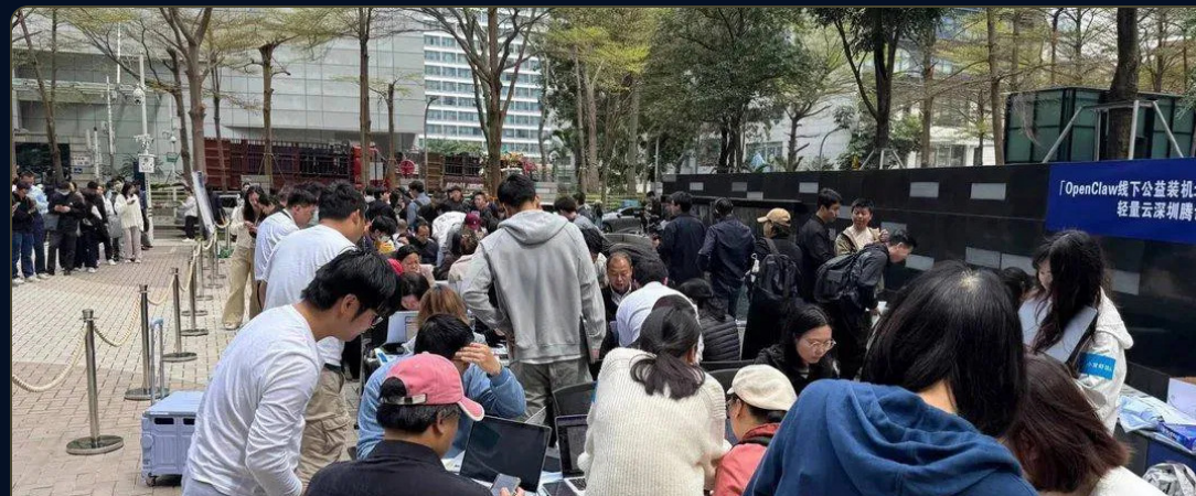
Очередь за установкой OpenClaw, Шэньчжэнь

Единый стандарт от Anthropic, OpenAI, Google, Microsoft и Amazon. Гонка моделей ускоряется.