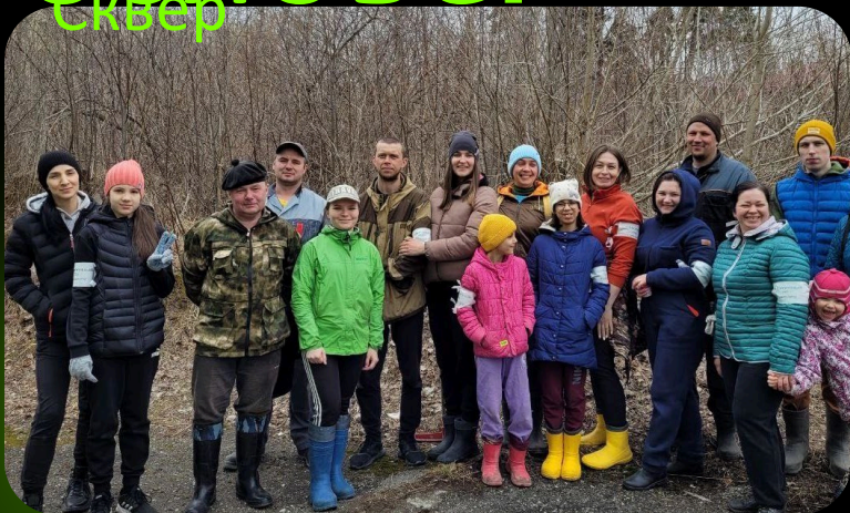
проект "Чистые игры ДГТ"